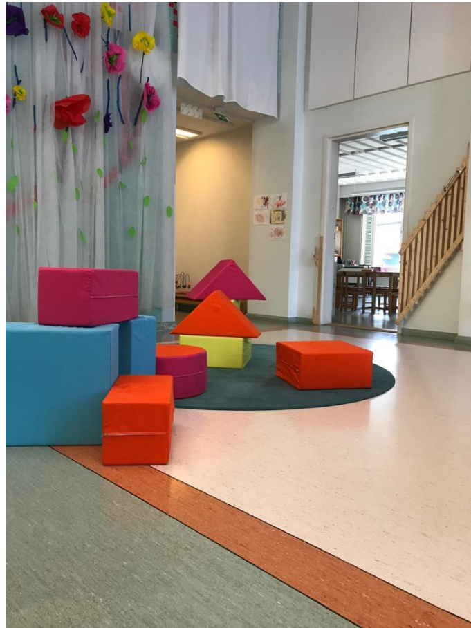
Kuva 4. Turvallisella ja idearikkaalla ympäristöllä vahvistamme lasten hyvinvointia.