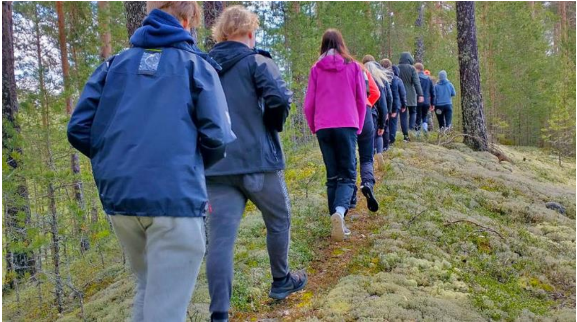
Kuva 3. Jokainen lapsi on tärkeä ja ainutlaatuinen.

Tavoitteena on, että suurin osa katselmuksista on järjestetty lokakuuhun 2024 mennessä, jolloin tehdään arviointi tämän toimenpiteen osalta. Mittarit: 1) Järjestettyjen katselmusten määrät ja 2) katselmusten vaikuttavuus (esim. lasten ja nuorten kommenttien huomiointi).